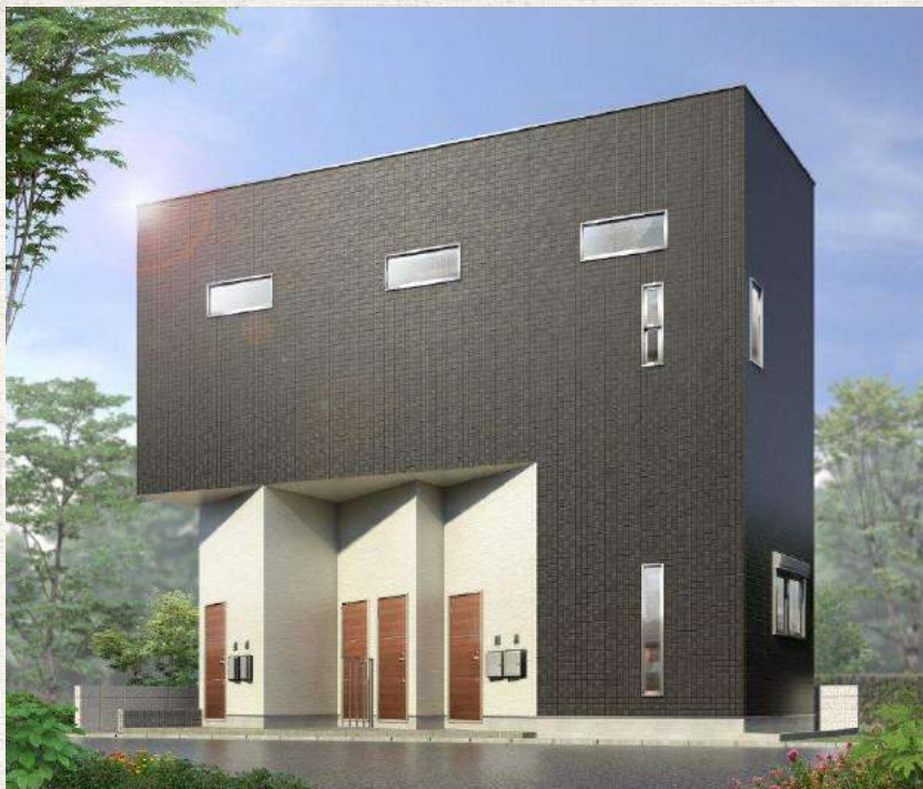
■写真と現場が違う場合は現況を優先とします。